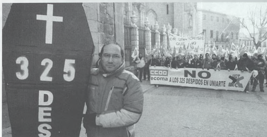
DIÁLOGO Y MOVILIZACIÓN FRENTE A LA CONFLICTIVIDAD LABORAL

Los precios cayeron en enero un 1'1% en Castilla-La Mancha y un 1% en Toledo, arrastrados fundamentalmente por las rebajas. Así, las prendas de vestir redujeron los precios más de un 12% y un 10% el calzado. En el grupo de alimentos, las mayores caídas las registró la carne de ovino (un 3'5%?, seguida por el aceite, el agua mineral y los zumos y otras carnes. La mayor subida de precios la registró el pescado (2'1%). En el último año los precios en la región se han incrementado un 0'9% y un 0'8% en Toledo.