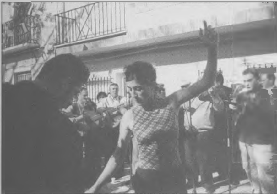
Una pareja ya familiar en los encuentros de cuadrillas

Cruz y los propios organizadores Aguilanderos de Barranda.