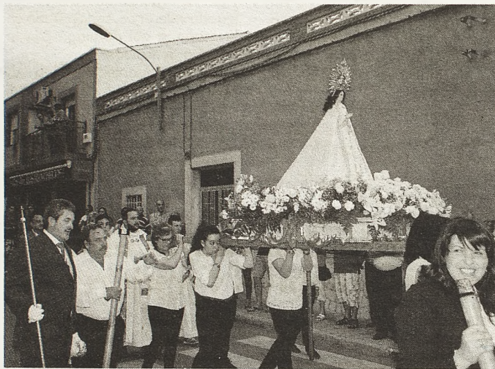
A San Juan le acompaña la imagen de la Santa Paz