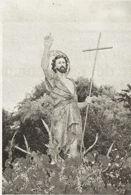
La imagen de San Juan recorrerá las calles del barrio del Lucero

Ya lo dice el refrán, ni frío hasta Navidad, ni calor hasta San Juan, y es verdad. El barrio del Lucero es un barrio típico de Valdepeñas que ya tiene todo preparado para la celebración de las fiestas.