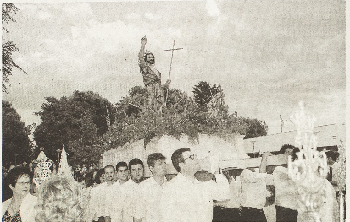
La imagen de San Juan Bautista en procesión

Felicidades a todo el barrio y a todos y todas las que celebran su onomástica.