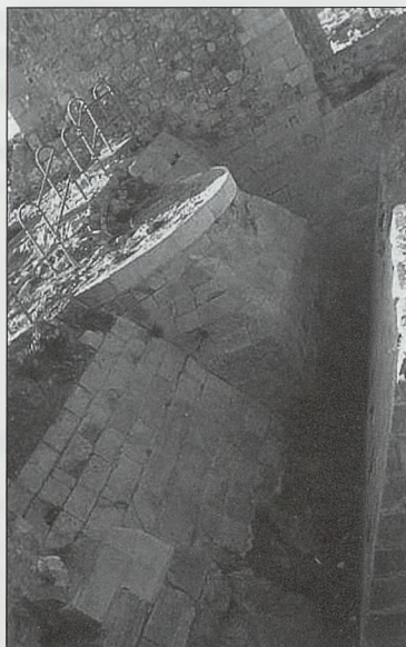
Fig. 19. Morón de la Frontera. Fase del siglo XVI

pobres y en los que habría que destacar especialmente el caso de Cote, donde no sólo se ha estudiado el monumento en sí mismo, sino también en su entorno.