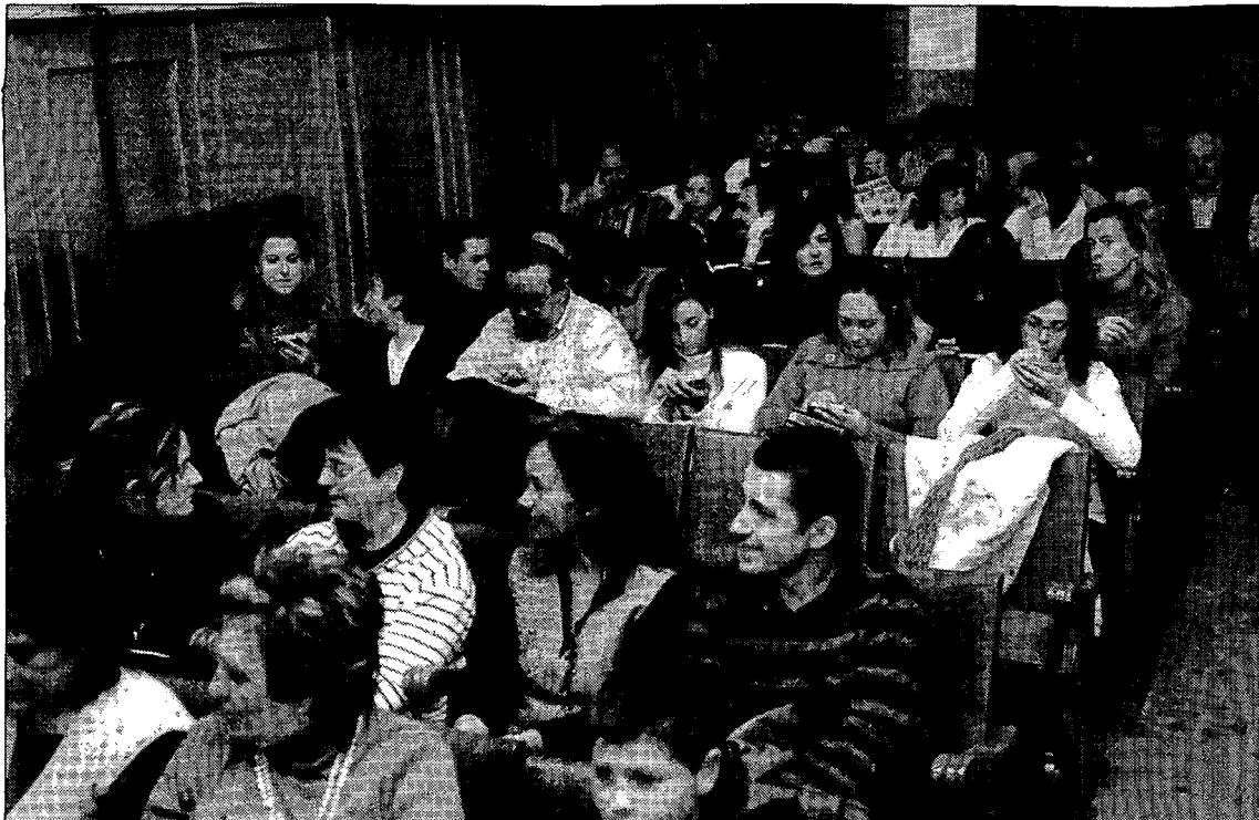
Padres y profesores se reunieron en el salón de actos del IES Alfonso VIII.