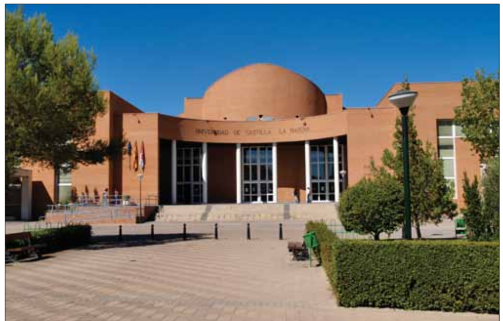
Vicerrectorado del campus universitario de Albacete.

Un dato especialmente significativo en el desarrollo económico de Albacete es el aumento de la oferta de suelo industrial, ya que mientras que en 1980 el Polígono Industrial Campollano, surgido de la iniciativa de promotores autóctonos, era el único existente, en la actualidad la oferta se ha extendido a más de 20 polígonos a lo largo de toda la provincia, entre otros, el de Caudete con la implantación