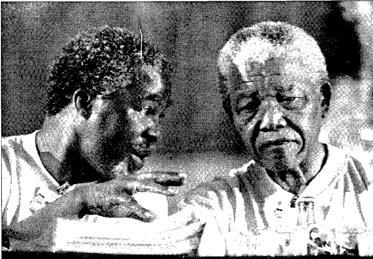
TRASPASO DE PODERES Thabo Mbeki (izda) con Nelson Mandela, ayer en el congreso del CNA en Mafikeng.

“Los que plantean esta exigencia tratan de negar el hecho de que es la pobreza deshumanizadora impuesta al pueblo por el sistema del