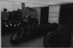
Adiós a la guerra de gomas.