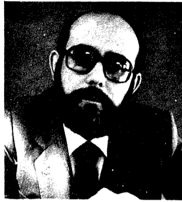
Los empresarios talaveranos escribieron dos cartas de protesta al Gobernador Civil.*

tar desde posiciones conjuntas las próximas convocatorias que el Gobierno haga a todas las partes Sociales, Económicas y Políticas, para la puesta en marcha del plan cuatrienal.