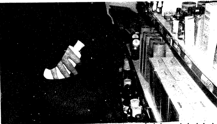
Los robos en supermercados son un indicio más de la escalada de la delincuencia en nuestra sociedad.