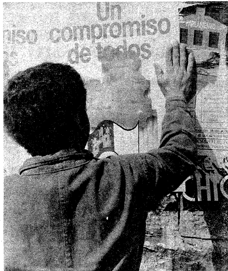
Carteles como el de la fotografía impulsan al voto y al compromiso de todos los castellano-manchegos.