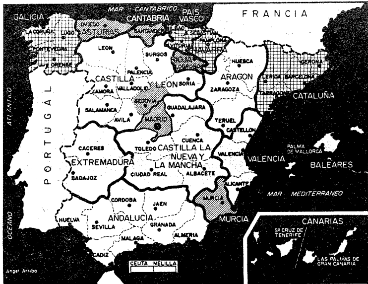
Castilla-La Mancha: una de las regiones más extensas de España, una de las más olvidadas.

El décimo día a partir de la proclamación de los concejales electos, es decir el día 23 de mayo o posteriores si el acto de escrutinio general no concluyó el día 13, se constituirán los distintos Ayuntamientos y en la sesión se elegirán los alcaldes, cargo al que pueden optar los cabezas de lista. Si alguno de ellos obtiene la mayoría absoluta, de los votos de los concejales, resultará electo. Si, por el contrario, ninguno consigue mayoría absoluta, será proclamado alcalde el cabeza de lista que obtuviera más votos en el correspondiente municipio; y, en caso de empate, se proclamará alcalde el de mayor edad.