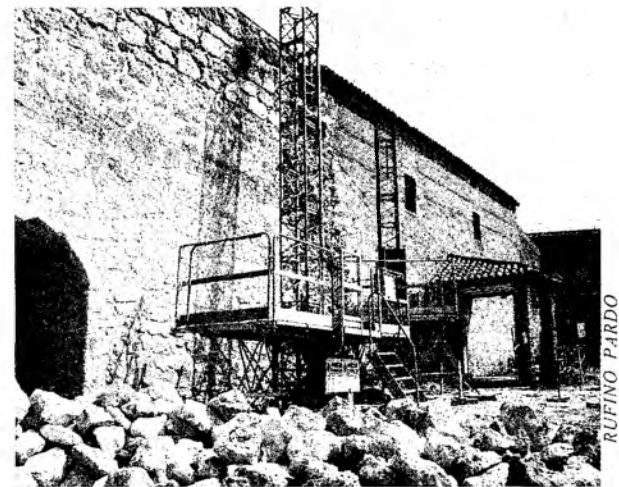
Detalle de las obras de reconstrucción del muro.

Los primeros trabajos realizados han consistido en la limpieza de los restos del muro que se han movido pero que no han llegado a desprenderse del todo. Para ello, se han instalado dos andamios de cremalle-