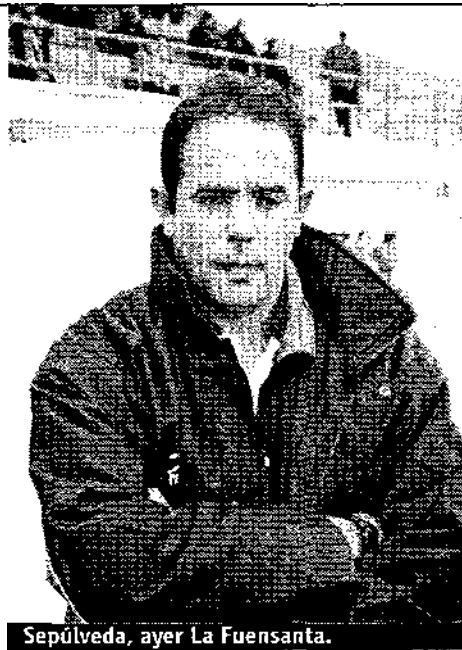
Sepúlveda, ayer La Fuensanta.

- Sí porque el nivel que tenía el Real Ma-