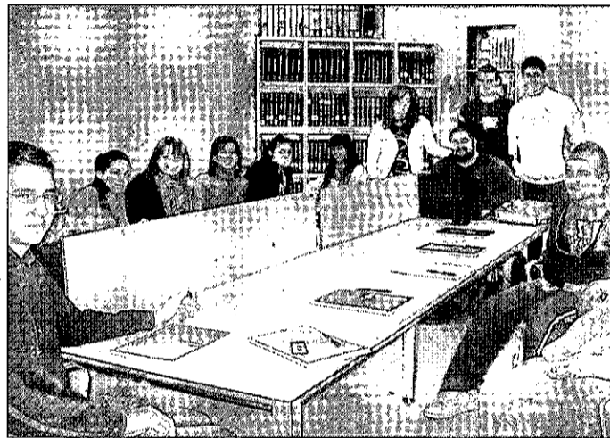
Algunos de los participantes en el curso de voluntariado.