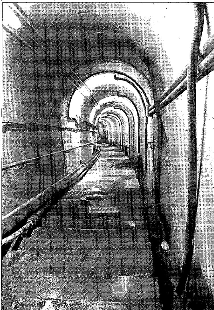
Imagen de una de las escaleras que lleva a la galería perimetral.

'La Tribuna' tuvo la oportunidad de visitar la presa por dentro, y lo cierto es que la experiencia impresiona. Desde fuera la pared da una apariencia de solidez que desde dentro se percibe como muy real, a pesar de las galerías abiertas a tres niveles de extremo a extremo de la pared. La visita transcurrió por la galería de contacto, situada en la parte media de la presa, pero bastaba con asomarse a algunos de los tramos de escaleras para comprender, enseguida, que bajar a la galería perimetral podría ser una sensación parecida al 'viaje al centro de la Tierra'. Las escaleras, interminables, estaban secundadas por tuberías del sistema de impermeabilización, y a lo largo de las galerías también se suceden las válvulas que controlan, entre otros aspectos, la presión que el agua ejerce sobre la pared de hormigón. La experiencia es, desde luego, inolvidable, y da una pequeña noción acerca de la magnitud de un proyecto que garantizará el abastecimiento futuro de agua para Puertollano y su comarca, tanto a nivel de uso cotidiano como para el desarrollo industrial.