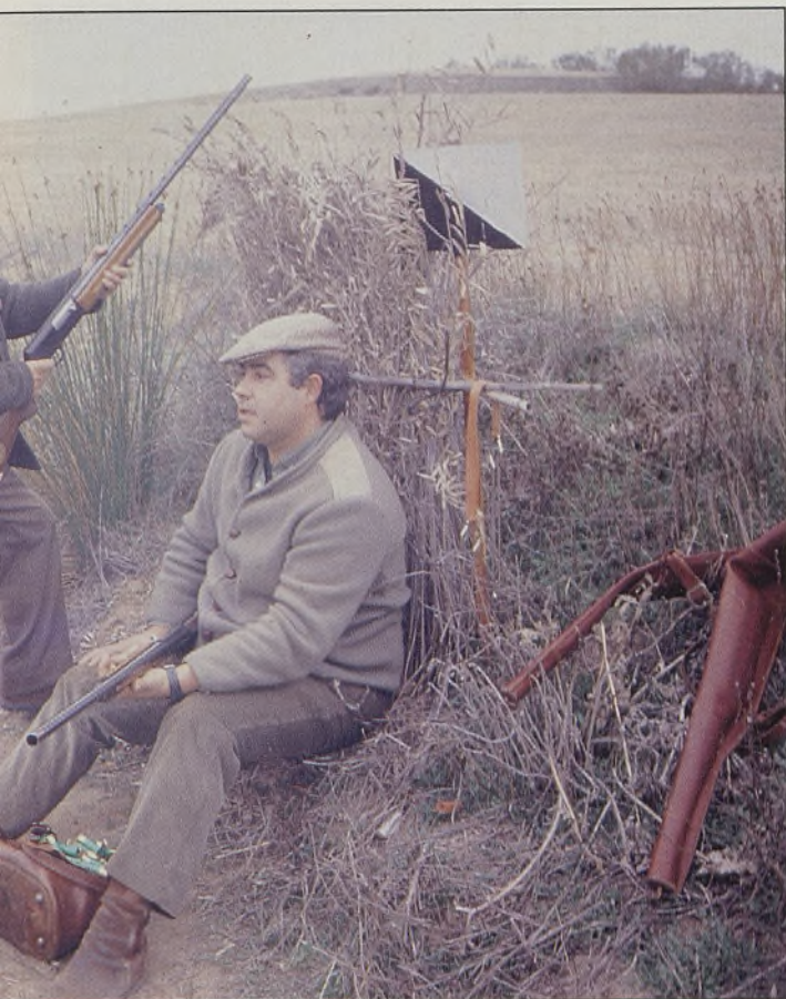
Ciudad Real y Toledo se verán tentados por las ofertas del extranjero.