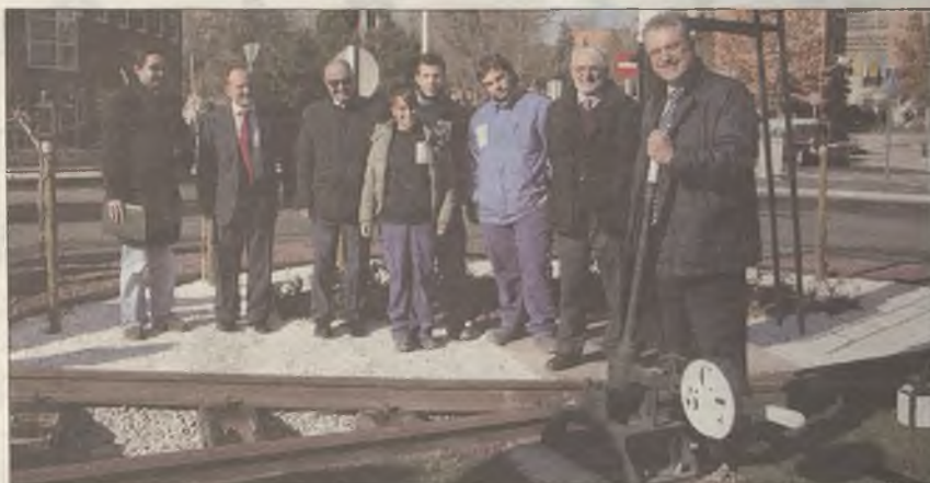
SOBRE RAÍLES. El alcalde, en la rotonda decorada con piezas ferroviarias

La coordinadora de Asociaciones de vecinos de Coslada exigió a finales de año el pago de estas cantidades comprometidas puesto que los socios se veían en la obligación de adelantar el dinero de sus propios bolsillos.