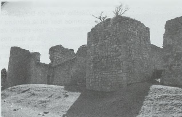
Muralla Norte. La torre cuadrada del primer plano tuvo su gemela en la parte Sur llamada «torre mocha». El muro que unía ambas torres cerraba el castillo viejo por el Oeste

mo periodo de tiempo. La fragilidad política fomenta la creación de señoríos y estos, para no desaparecer en la tempestad de pactos y ausencia de seguridad, necesitan de una casa fuerte que posibilite la estabilidad del territorio dominado: "Los preladados de Castilla, durante el turbulento siglo XV, disponían, como señores, de algunas fortalezas, propias de la mitra, para defenderse y resistir los embates políticos" 9 .