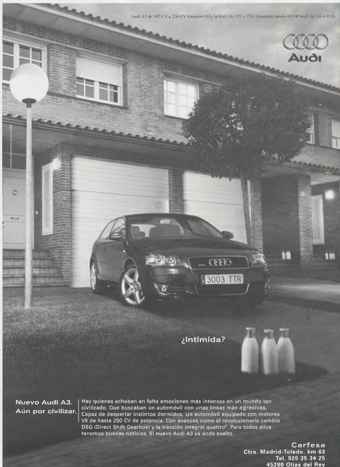
Audi A3 de 102 CV a 250 CV. Emisión CO 2 (g/km): de 151 a 259. Consumo medio (l/100 km): de 5,6 a 10,8.