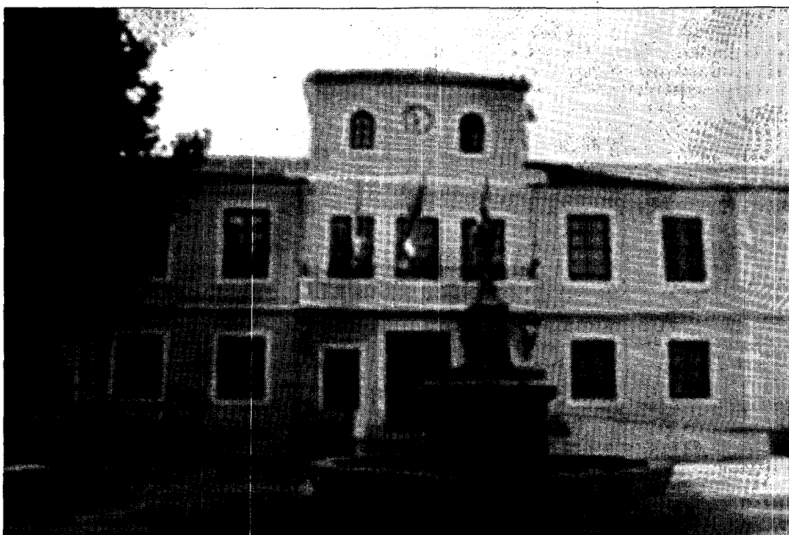
Ayuntamiento de Quintanar del Rey./L.T.

Por lo que han transmitido los propios participantes, se puede recoger una buena reflexión del curso, además de manifestar su actitud de mejora y humildad, que entendían era absolutamente necesaria como para cuestionarse esas posibilidades de mejora, añadiendo en líneas generales el alto grado de satisfacción.