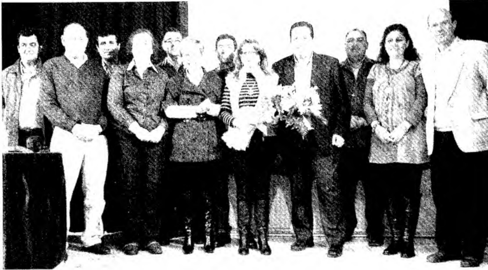
Dirigentes locales y provinciales del PP al término del Congreso.