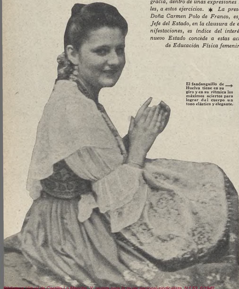
El fandanguillo de Huelva tiene en su giro y en su rítmica los máximos aciertos para lograr del cuerpo un tono elástico y elegante.