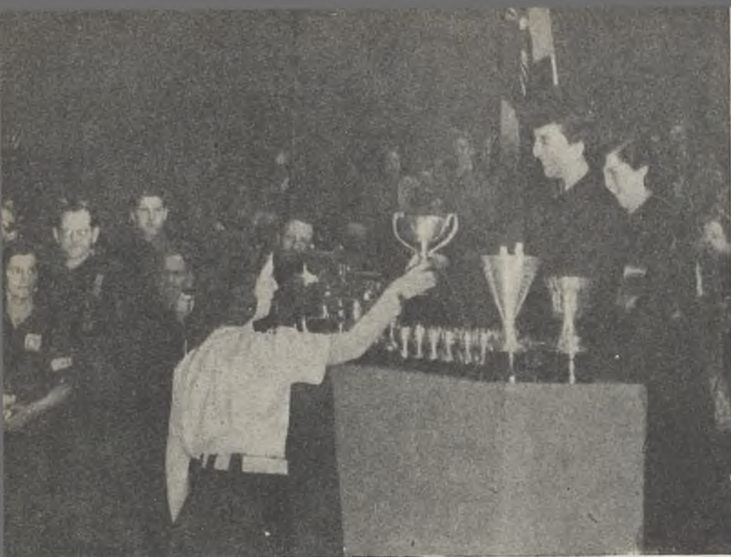
La Excelentísima Señora Doña Carmen Polo de Franco hace entrega de los premios concedidos durante el certamen. La esposa del Caudillo es acompañada por nuestra Delegada Nacional.