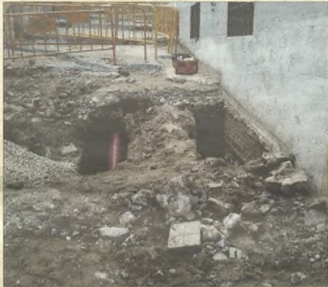
> Un repartidor sufrió hace unos días un accidente en la calle Horno de San Gil, completamente levantada, cuando llevaba el suministro a los bares de la zona. Un auténtico peligro.