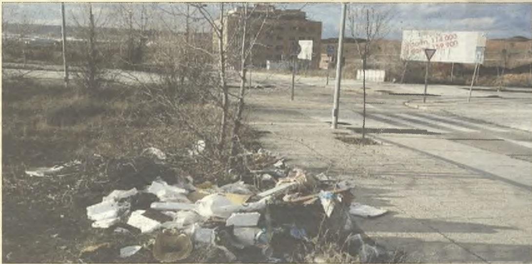
> El Ayuntamiento de Guadalajara tiene abandonado el barrio del Remate Las Cañas. Los vecinos llevan meses dirigiendo quejas al alcalde, sin obtener respuesta.

Haznos llegar imágenes de aquellas situaciones o cuestiones que quieras denunciar públicamente y nosotros intentaremos recogerlas en esta sección ( redaccion@lacalle.info ):