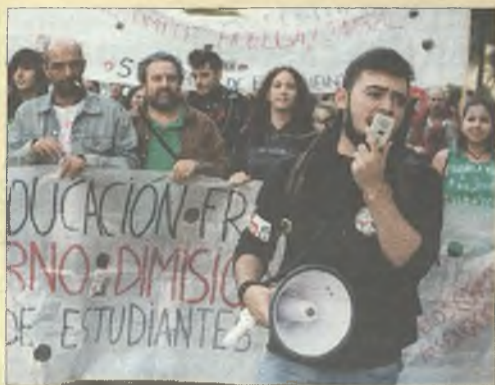
> Los estudiantes, profesores y el resto de la comunidad educativa, siguen en lucha.