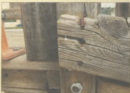
> ¿Parques para niños? Éste, en Av. Francia.