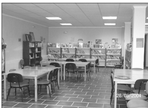
Una de las salas de la Biblioteca