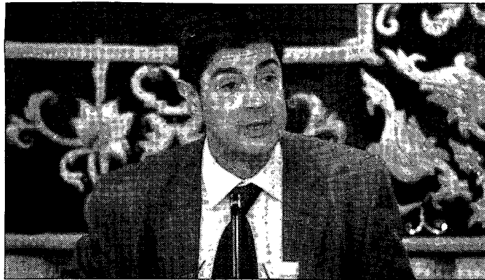
El presidente de la Diputación, Juan Ávila.

El presidente de la Diputación Provincial de Cuenca, Juan Ávila, fue preguntado al término del pleno de ayer sobre las intenciones del equipo de gobierno del Ayuntamiento de Cuenca de gestionar directamente los impuestos que cobra a sus ciudadanos y no a través del Organismo Autónomo de Recaudación. Ávila afirmó no tener constancia formal de esta idea y advirtió que si esta decisión se materializa «se rompería una tradición de solidaridad entre los municipios de la provincia de Cuenca» y se podría pedir un acto de compensación al Ayuntamiento de Cuenca, ya que esa actitud no puede suponer una merma en el dinero que la Diputación invierte en el resto de municipios.