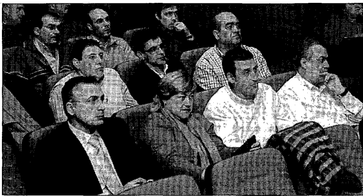
Profesionales que asistieron al acto.