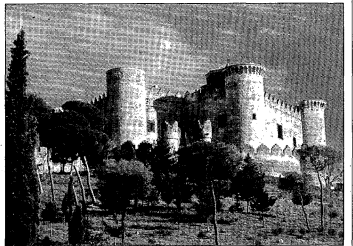
Se trata de la única actuación en nuestra provincia. / LA TRIBUNA

En total, son 78 las actuaciones las que el Ministerio de Fomento ha financiado a lo largo de esta legislatura. Lo que ha supuesto destinar, por parte de Fomento, un total de casi 160 (158,95) millones de euros, con cargo a los fondos del 1% cultural. Estas cifras representan un fuerte incremento, tanto en número de actuaciones financiadas (un 56% más) como en importes de subvenciones tramitadas (el 92% más), en relación con lo ejecutado a lo largo de toda la legislatura anterior.