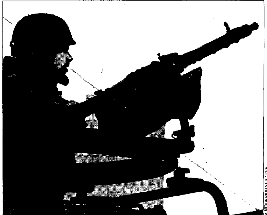
MIRANDO AL CIELO Un soldado de la SFOR vigila en la azotea del hotel 'Holiday Inn' de Sarajevo.

Las autoridades rusas prohíben la entrada en Chechenia por razones de seguridad