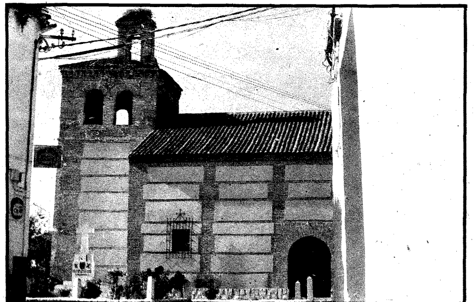
Una vista de la Iglesia Parroquial.