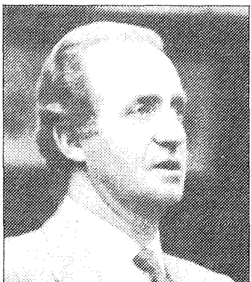
Según el fiscal que atiende el caso, de diferentes publicaciones «se desprende un menosprecio hacia la persona del Jefe del Estado».

Tres meses después, el 20 de febrero de 1986, «El Cocodrilo» publicó otro artículo firmado con el seudónimo «Juan Mari Barbiánsó», también destacado con grandes titulares, ideados, según el fiscal, por el director del semanario.