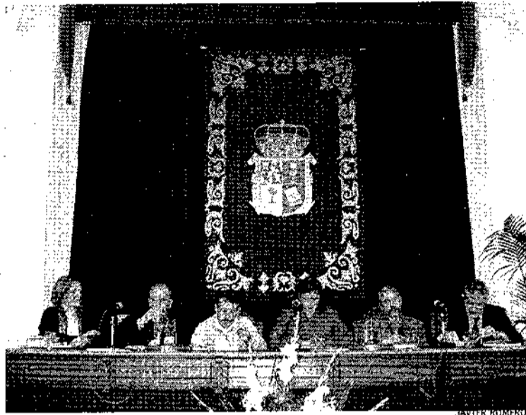
Imagen de la presentación de los libros, ayer en Diputación.

Para hoy jueves, está previsto celebrar el acto de entrega del