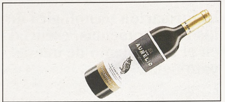
Don Aurelio Syrah y Gran reserva

La familia Navarro López quiere mostrar todo su agradecimiento por el reconocimiento mostrado a su trabajo y la valoración recibida por parte del jurado del comité de cata.