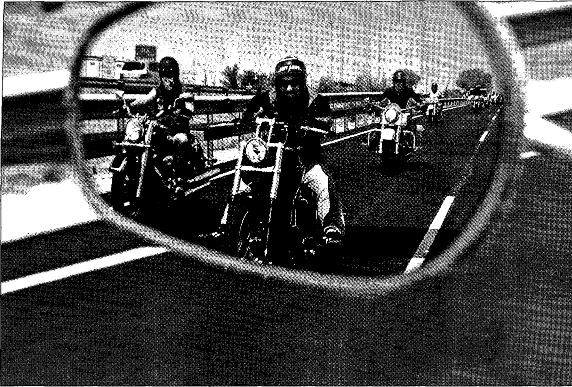
La estética y vehículos de los detenidos están inspirados en las bandas norteamericanas.