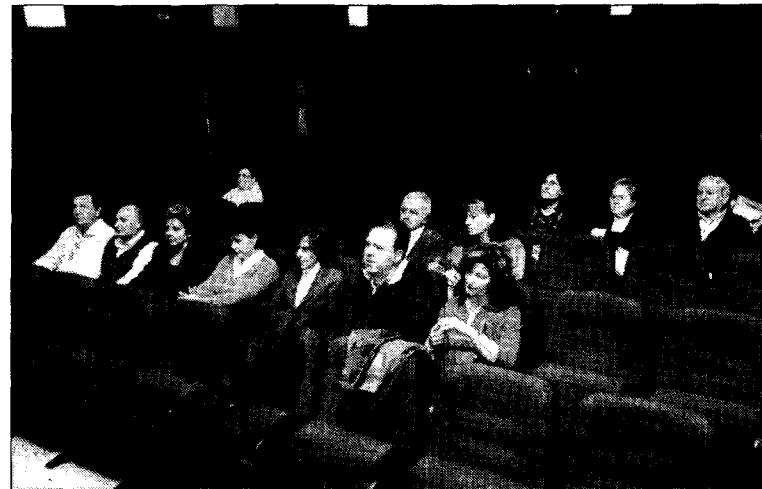
El acto tuvo lugar en el Centro Cultural Aguirre.

Garrido señala en su obra, al margen de otras muchas virtudes del personaje que fue «ante todo fue un intelectual comprometido con su época y con su país, al que intentó mejorar a través de distintas facetas que cultivó y desarrollo con brillantez: política, estadística, geografía, agricultura, moral, educación, opinión pública, crítica».