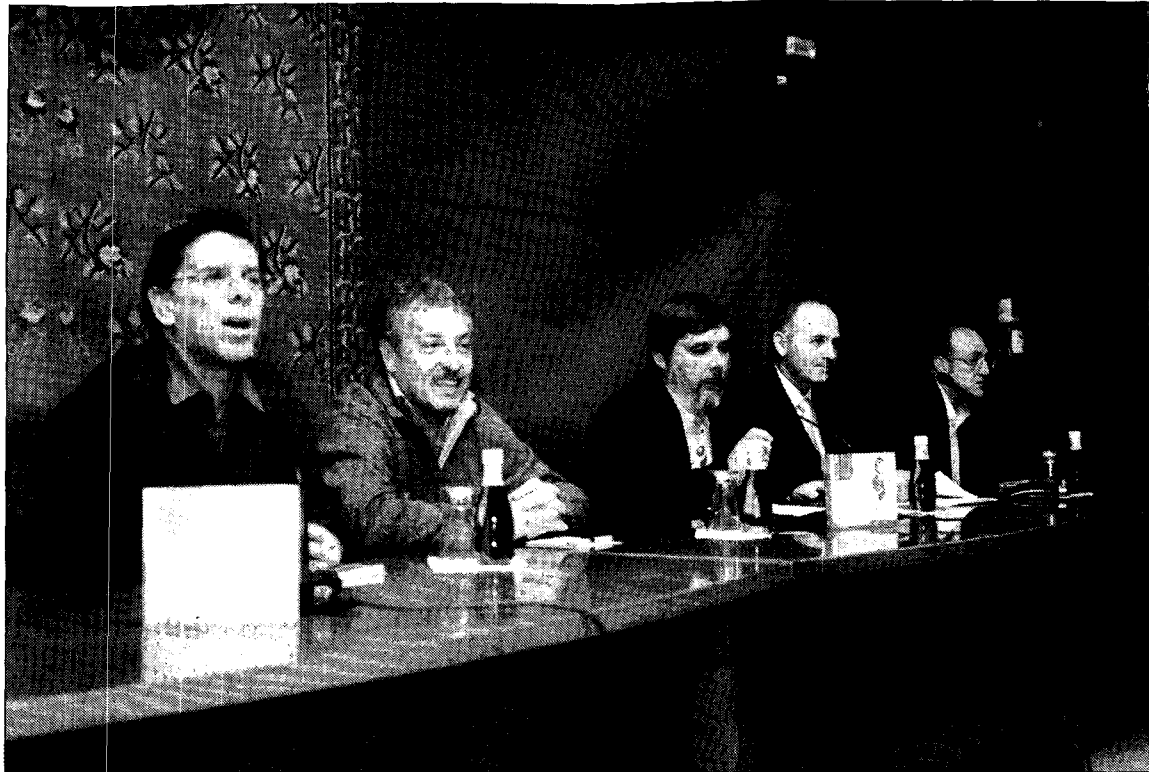
Los autores de las biografías acudieron al acto de presentación.

El autor de la biografía hace especial hincapié en el «trágico destino histórico, condenado en 1560, una vez ya fallecido, como hereje luterano de Sevilla en una España