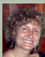
Rosario Ecuador JCCM