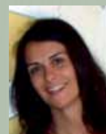
Sonia República Dominicana INTERED