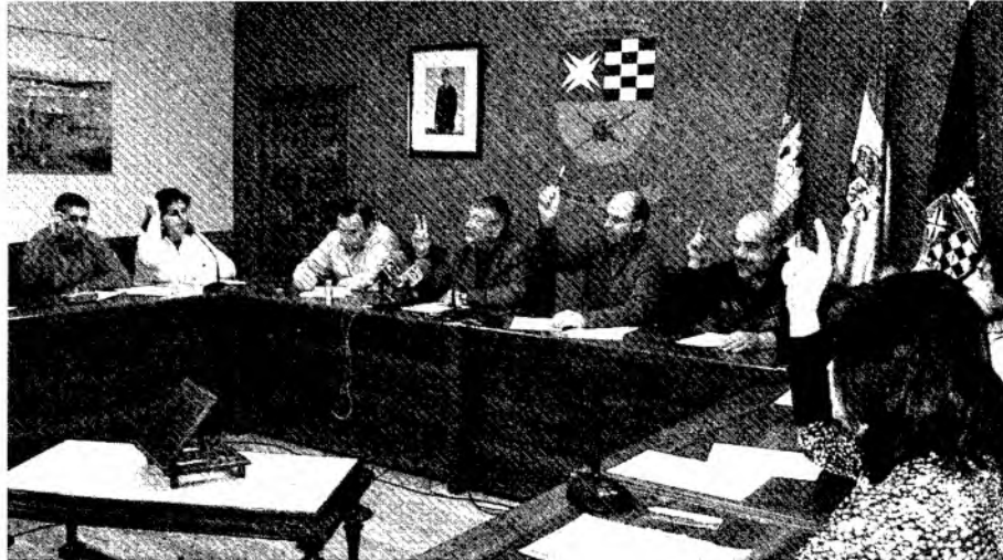
Momento de la votación unánime del Pleno por la integración ferroviaria.

En una moción que fue previamente consensuada por los tres grupos de la Corporación, se pidió también al presidente del Gobierno de España, José Luis Rodríguez Zapatero, "que dando cumplimiento a su promesa electoral impulse las actuaciones precisas para que el Ministerio in-