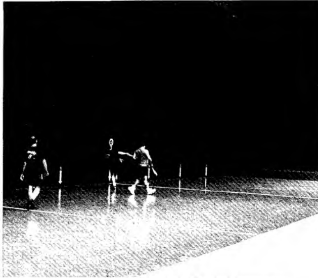
Nuevo frontón en el pabellón de la Ciudad Deportiva.

Actividad investigadora: Biodiversidad de la microbiota