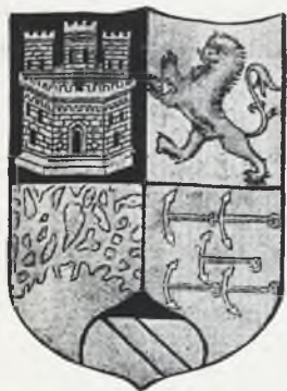
Armas de Colón