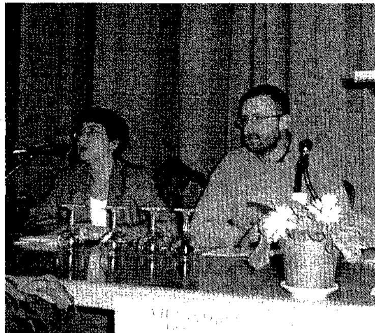
EL DÍA La VII Asamblea de Caritas contó con una gran participación y la representación de prácticamente todos los arciprestazgos de la Diócesis.