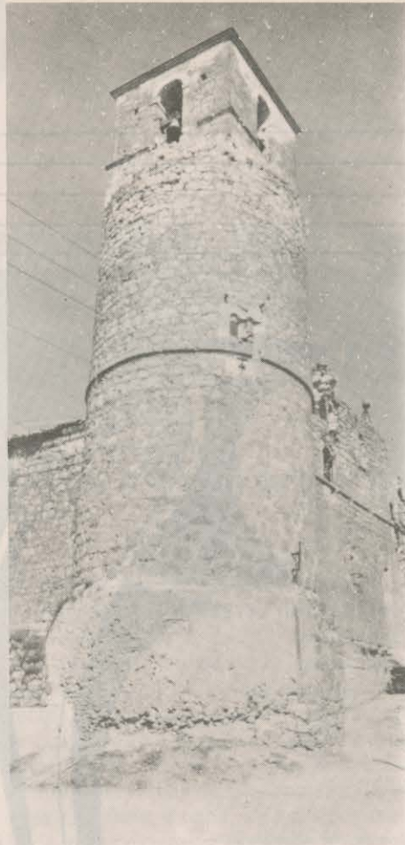
EL AIROSO TORREON

“La importancia de los restos del Castillo en la actualidad está en función de su estratégica posición por lo que constituye un elemento singular positivo dentro del paisaje manchego en que se encuentra enclavado con un amplio campo de visuales a lo largo de las carreteras N-III y N-420... apareciendo su