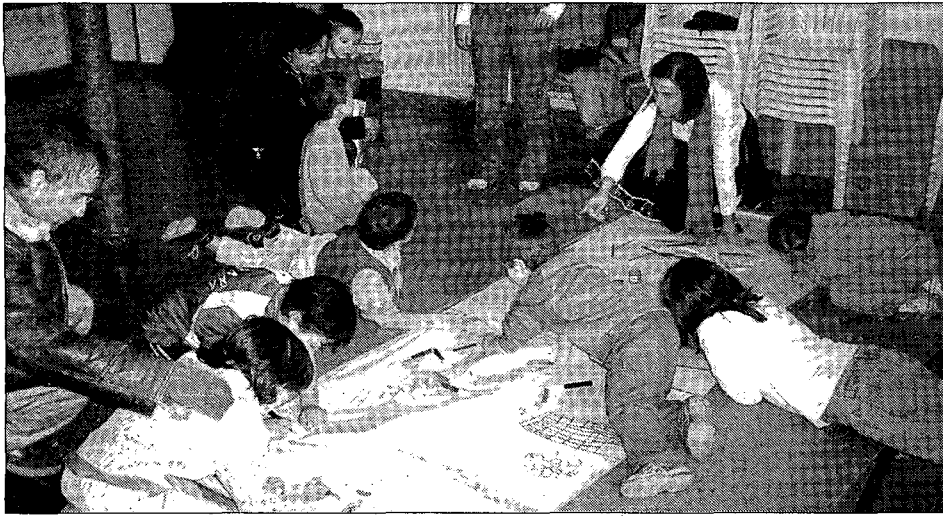
Hubo talleres para los niños./L.T.