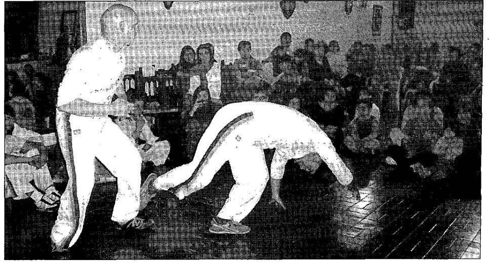
Demostración de capoeira.