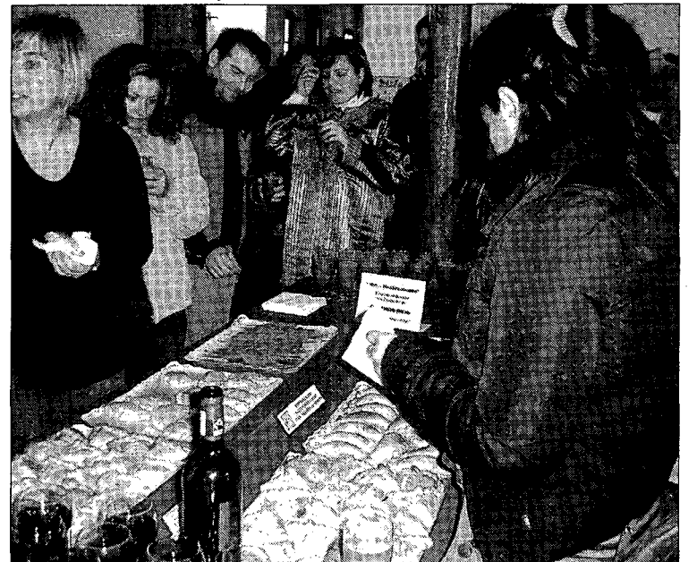
Degustación gastronómica de diferentes platos.

cada brasileña' recorrieron la localidad de las Pedroñeras atrayendo a gran cantidad de público. A continuación se procedió a la inauguración oficial de la jornada con discursos y entrega de premios mural intercultural, así como reconocimiento a personas y entidades que han hecho posible el éxito del proyecto Pangea. Posteriormente se pasó a los títeres con el cuento de Murrún y los Gatos de las Cuatro Esquinas. También hubo una comida y talleres interculturales.