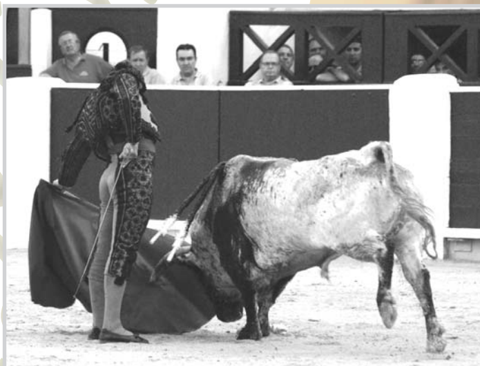
Morante de La Puebla.