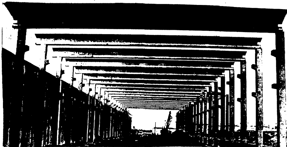
(Fábricas: C.Real, Toledo, Albacete, Cuenca)

GRANDES NAVES CUBIERTA PLANA PARA LUCES DE HASTA 40 M.