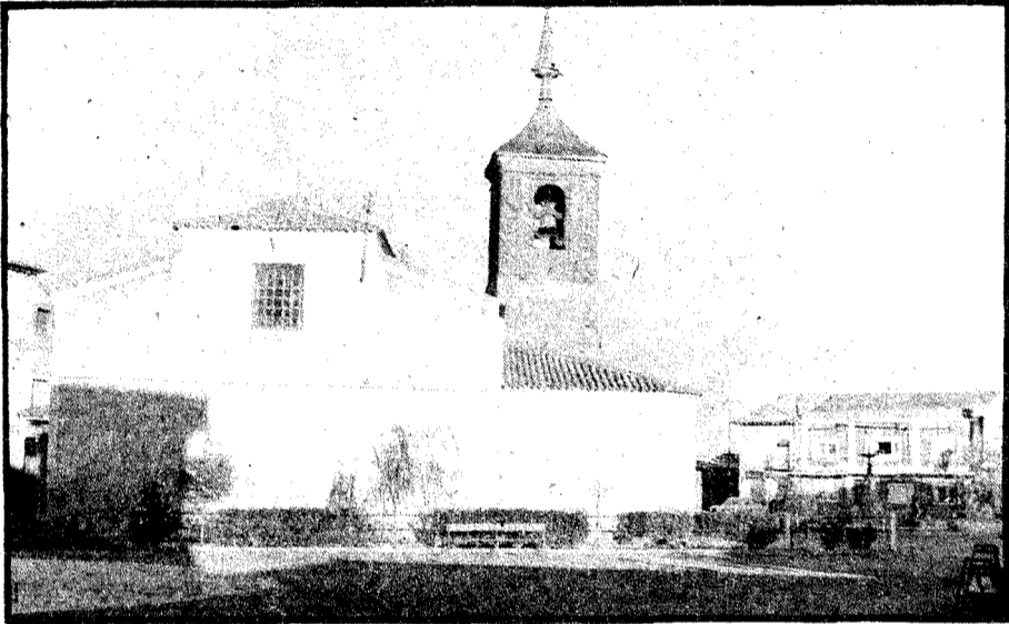
Parroquia de San Pedro Apóstol, una de las más viejas de la diócesis.

Ha sitio Santa Olalla, desde el 1083 —año en que los caballeros del rey don Alfonso la rescataron para Castilla— la posesión de un noble, el conde de Orgaz, que explotó sus tierras y doblegó el espinazo de sus campesinos. La conquista por Alfonso VI arrojó de sus campos a los moriscos; y el descubrimiento de América alejó a las personas más emprendedoras, que partieron en busca de aventura y de riqueza. ¿Es extraño que el labrador rico