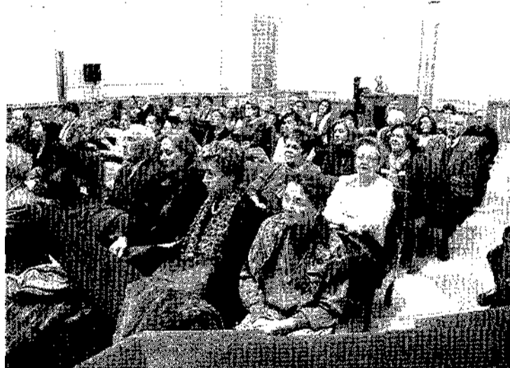
Publico asistente a la entrega del premio Alonso de Ojeda.

• El Viaje del Dreyer , visión iniciática del Sáhara, ha quedado finalista