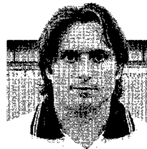
Carrasco marcó ayer.