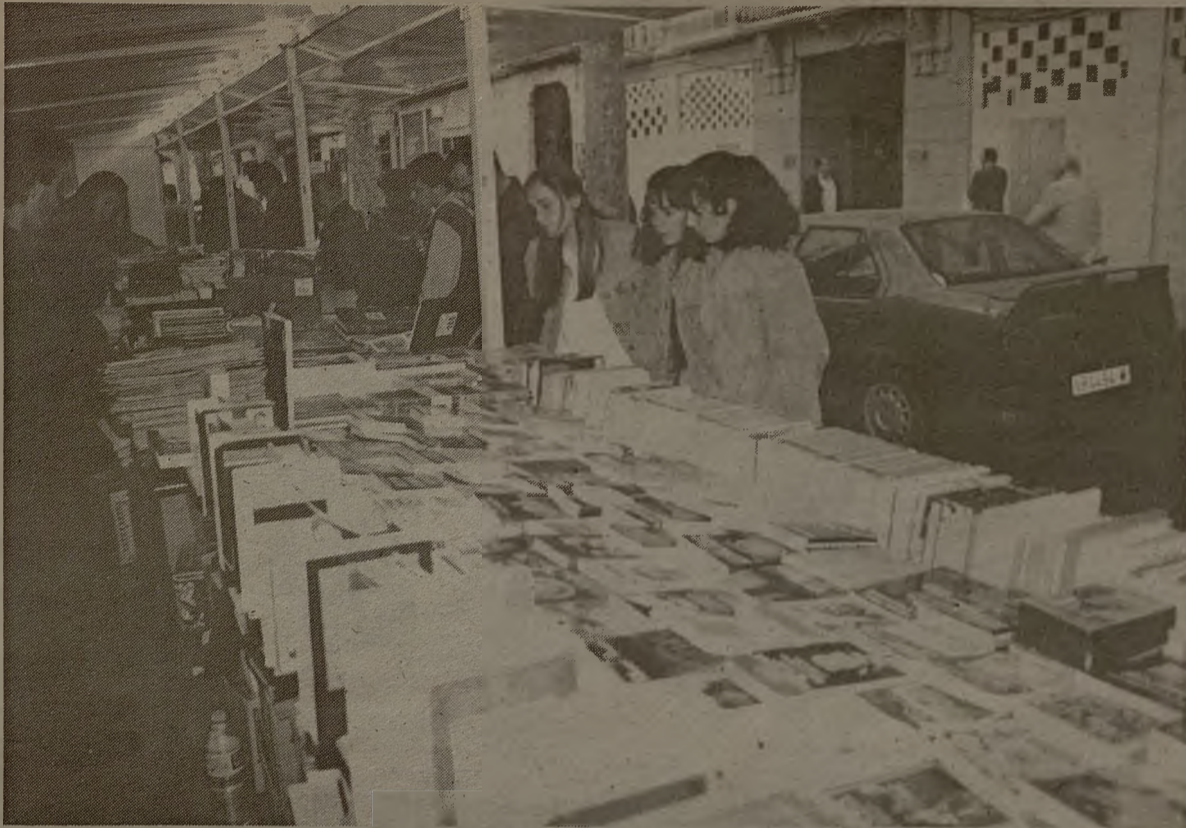
La afición a la lectura se va extendiendo progresivamente en Albacete gracias a la promoción que hacen las bibliotecas.

Dentro del patronato de la Universidad Popular, funciona la unidad de bibliotecas municipales, encargada de coordinar y gestionar el servicio de estos centros. Actualmente existen en Albacete y pedanías ocho bibliotecas, con un centro coordinador en la calle de la Paz y otra