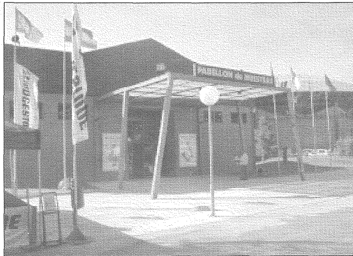
La 45ª edición de la Feria Regional del Campo y Muestras (FERCAM) de Manzanares, entre el 13 y el 17 de julio, propiciará que un total de 220 expositores llenen por completo el recinto ferial.

FERCAM 2005 tendrá un presupuesto de 260.000 euros. Además el Ayuntamiento de Manzanares acometerá este año otras inversiones para mejorar el recinto