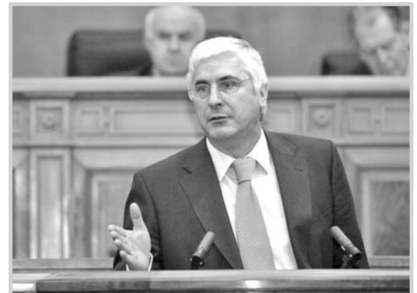
José María Barreda.

Respecto al agua, el presidente Barreda aseveró que su postura es aprovechar la ocasión para terminar con las contradicciones que existen en relación al agua, "no se concibe que tenga-