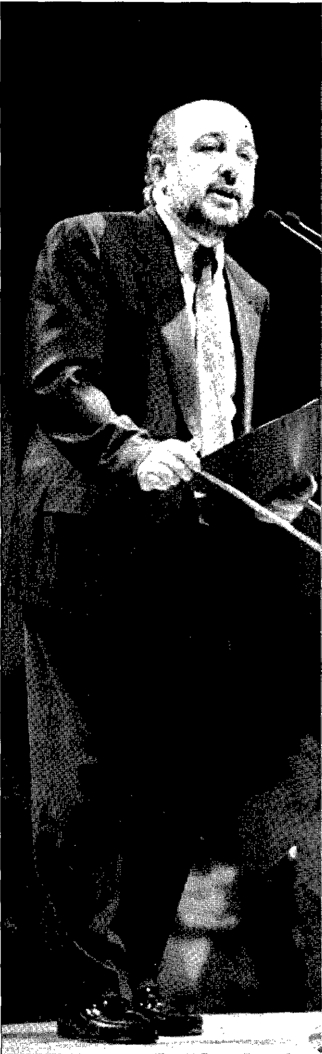
REPUDIO Almunia cree imposible que Liaño siga en la Audiencia Nacional.

Anguita reiteró el "asco" que le producen los organizadores e inductores de la grabación y difusión del vídeo, a quienes llamó "gente de la peor calaña", y añadió, con tono de indignación: "Como, para denigrar a los adversarios, vayamos a inquirir en las alcobas, este país será un estercolero".