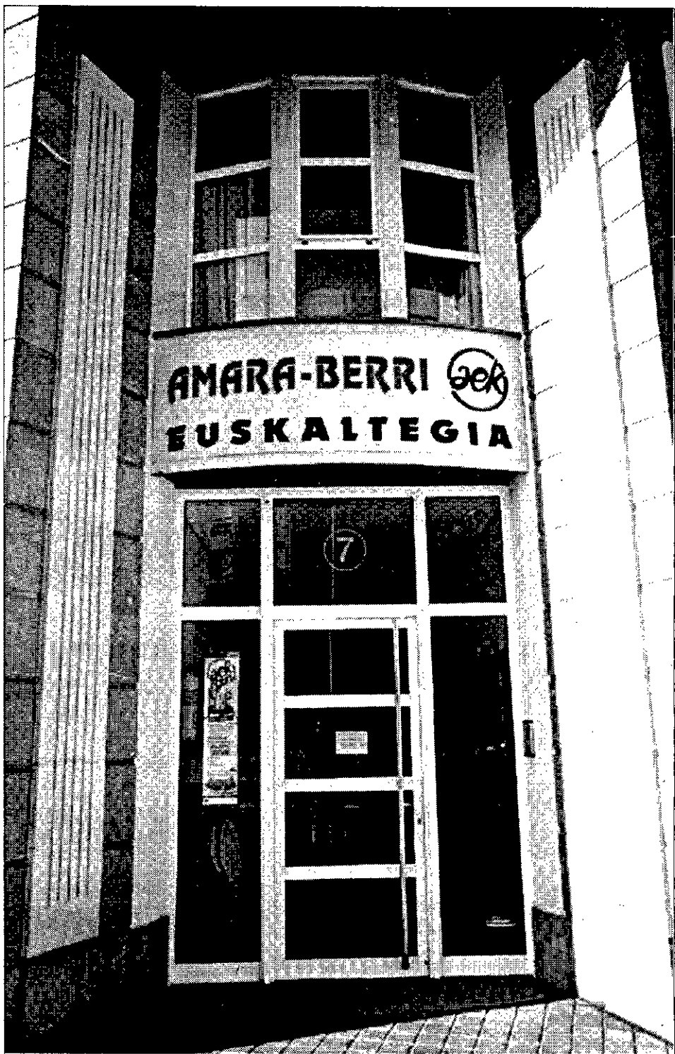
EN LA PICOTA Entrada al centro de la AEK donde se ha impartido a funcionarios la metodología del secuestro.